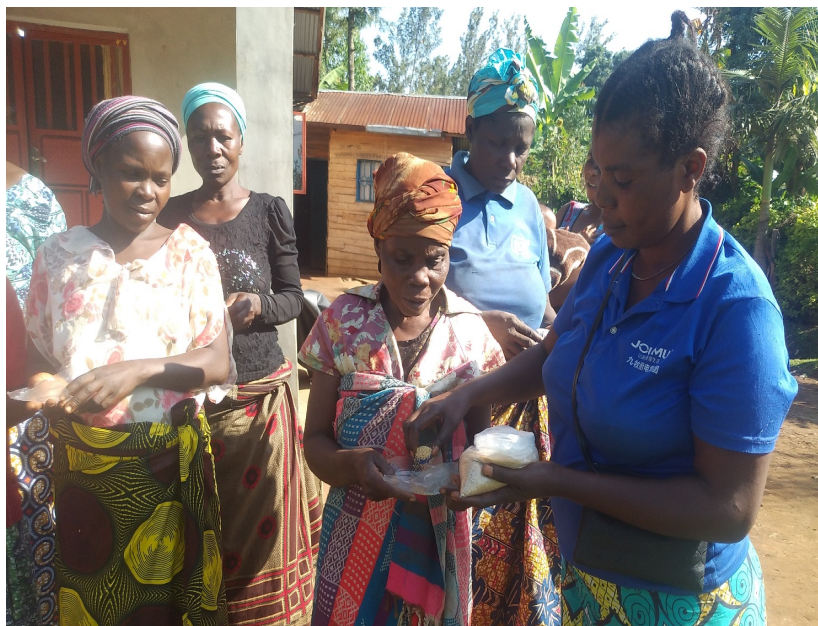
Figure 5 Lors de la distribution des semences maraichères aux femmes des OP

A certains endroits, les femmes n'ont pas utilisé les semences dans leurs champs suite à l'insécurité.