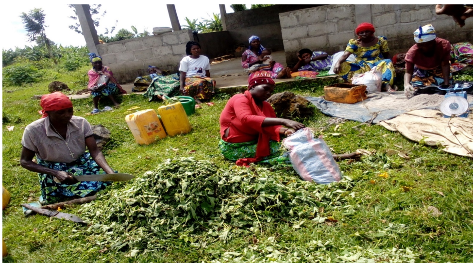
Figure 1. Préparation des ingrédients pour les Biofertilisants et pesticides liquides (l'eau, titonia, cendre, feuilles de papayer, fumier animal)