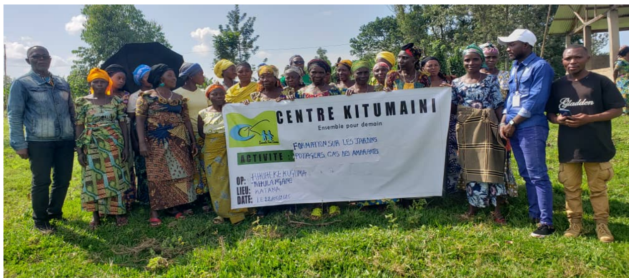
Figure 4 Lors des formations des OP sur le maraichage

Dans le but de renforcer les connaissances des femmes dans la production des cultures maraichères (amarante, oignon, aubergine, carotte, tomate, poivron, céleri, courgette, poireau et chou), des séances de formations ont été organisées en faveur de 200 femmes productrices identifiées dans les OP (Organisations Paysannes) qui à leur tour, devront faire la restitution des enseignements de la formation aux autres membres de leurs groupes respectifs.