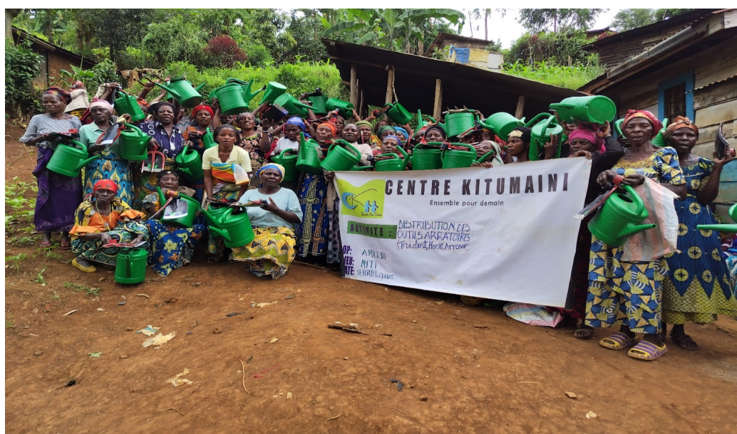
Figure 8 Lors de la Distribution des outils aratoires (Houes, tridents, arrosoirs) en Novembre