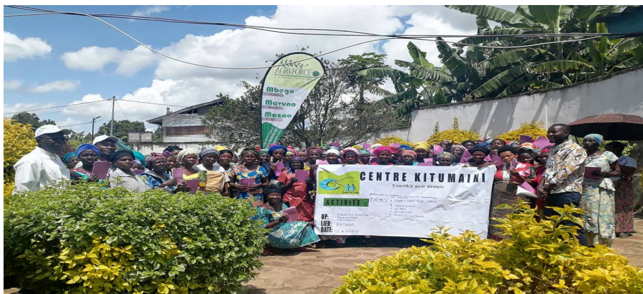
Figure 3 Lors de la Formation sur les Bonnes pratiques agronomiques du haricot

En septembre 2025, le Centre Kitumaini a procédé à l'achat et la distribution des semences de haricot et de maïs de première génération : 2015 kg d'haricot et