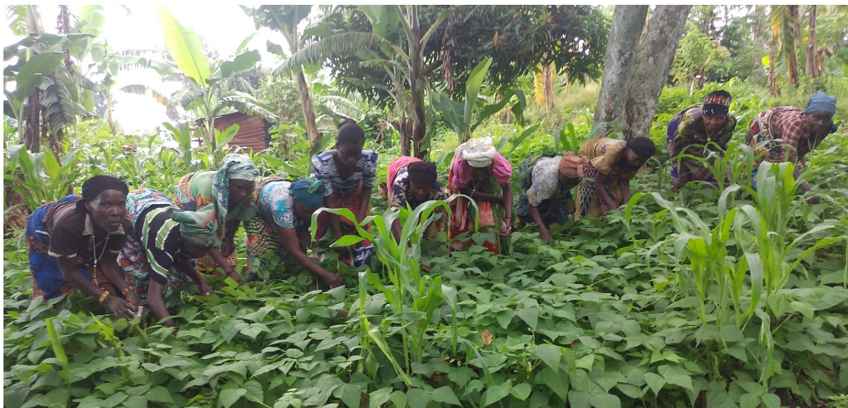
Figure 9 Lors de traitement des champs contre la chenille légionnaire et rongeurs