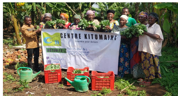
Figure 6 Lors de la distribution des plantules maraichères

8080 plantules ont été produites et distribuées aux femmes.