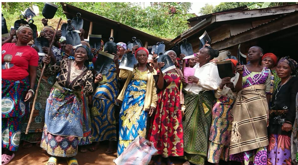
Figure 7 Lors de la Distribution des houes (Mars et Avril)

En octobre de la même année, 165 kits d'outils aratoires constitués de 165 houes, 165 tridents et 165 arrosoirs ont été distribués à 165 autres femmes bénéficiaires. Au cours de cette année, 665 femmes ont donc reçu des outils aratoires suite aux pertes énormes en intrants et outils agricoles subies par les femmes ont connues à cause de la guerre à l'Est de la RDC.