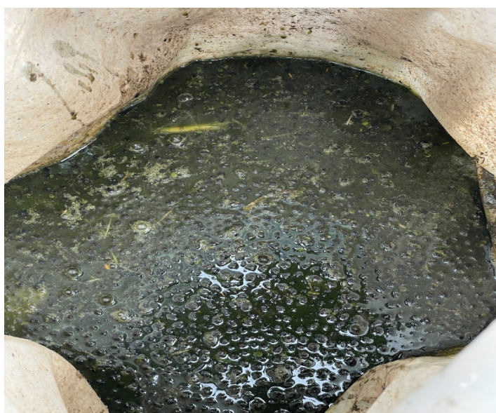
Figure 2. Produit obtenu après mélange des ingrédients à conserver pour être utilisé après 14 jours