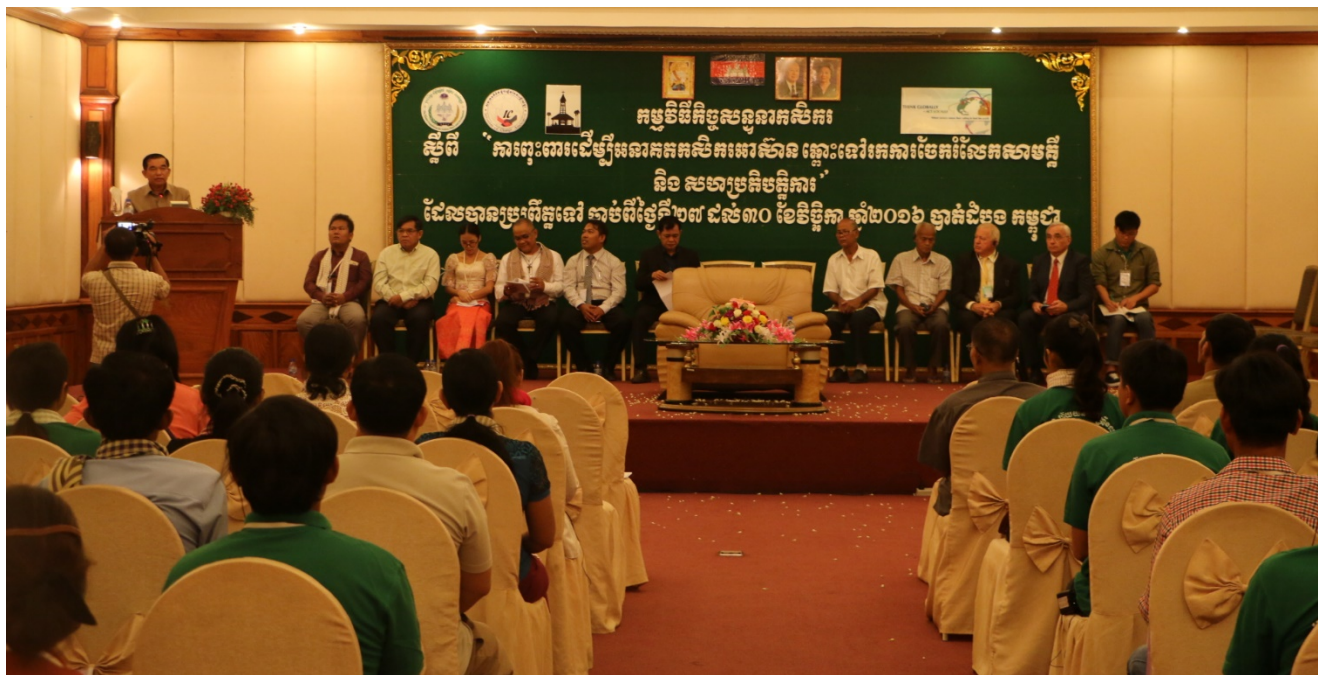
1- Cérémonie d'inauguration

Des agriculteurs venant du Cambodge, d'Australie, d'Europe, de l'Inde, du Japon, de Corée et de Taïwan se sont réunis pour exprimer leur solidarité dans un monde mondialisé, pour affirmer le rôle essentiel de l'agriculture dans ce monde, pour reconnaître la dignité des agriculteurs en tant que producteurs de l'alimentation de la communauté humaine et pour souligner la nécessité de sécurité pour leur mission de nourrir le monde.