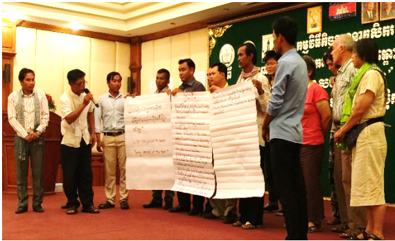
7- Décisions de groupes

– Que peux-TU faire avec toutes les connaissances et informations reçues lors de ce Dialogue entre Agriculteurs ?