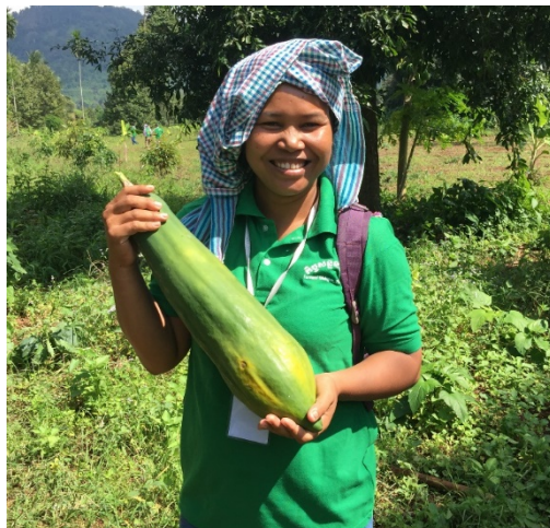
4- Papaye biologique