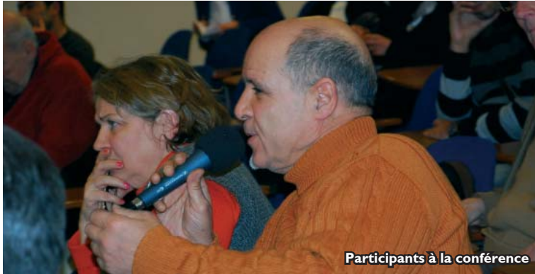
Participants à la conférence

“ Nous avons à faire un effort intellectuel théologique : nous devons résoudre des problèmes de notre temps au lieu de diffuser une théologie anachronique par rapport aux questions de la vie, de la mort, de la bioéthique, de la physique... ”