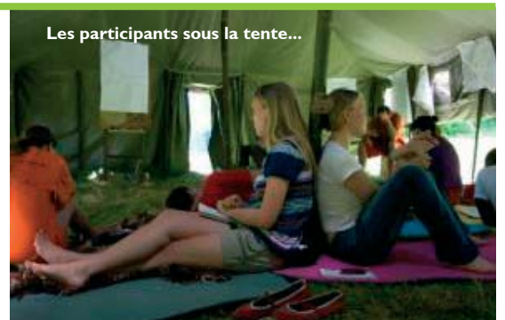
Les participants sous la tente...

Nous avons terminé la semaine en beauté avec une soirée talents show où chacun avait pu préparer un sketch, poème, chanson ou histoire à raconter. Quelques participants ont