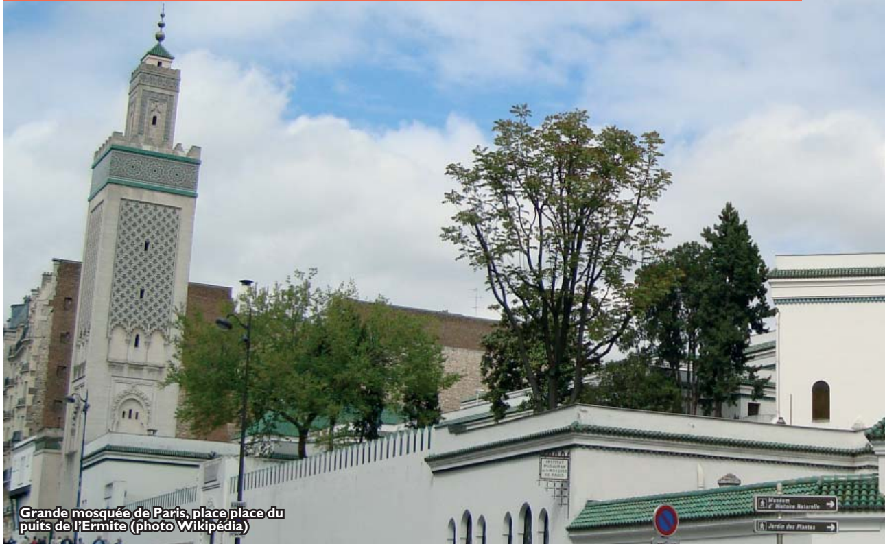
Grande mosquée de Paris, place du puits de l'Ermite